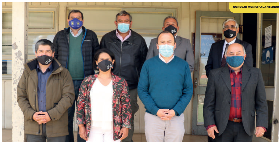
CONCEJO MUNICIPAL ANTERIOR