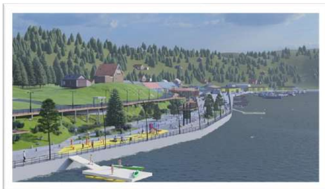
Imagen N°5: Mejoramiento Borde Costero sector Queule