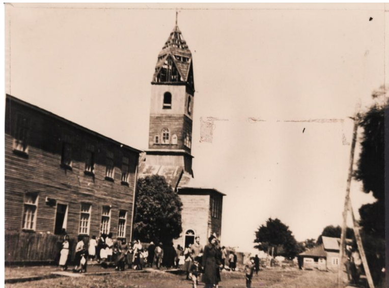
Fotografía 62. ñDesarme de la iglesia de Toltén