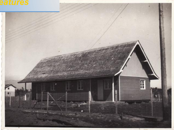
Fotografía 77. ò un tipo de las casa de población Holandaö

Click Here to upgrade to Unlimited Pages and Expanded Features