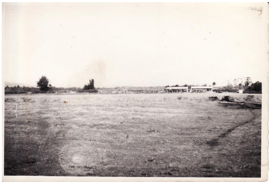
Fotografía 65. Continúa la construcción de los Trabajos material facilitado por Sra.Hilma Munro