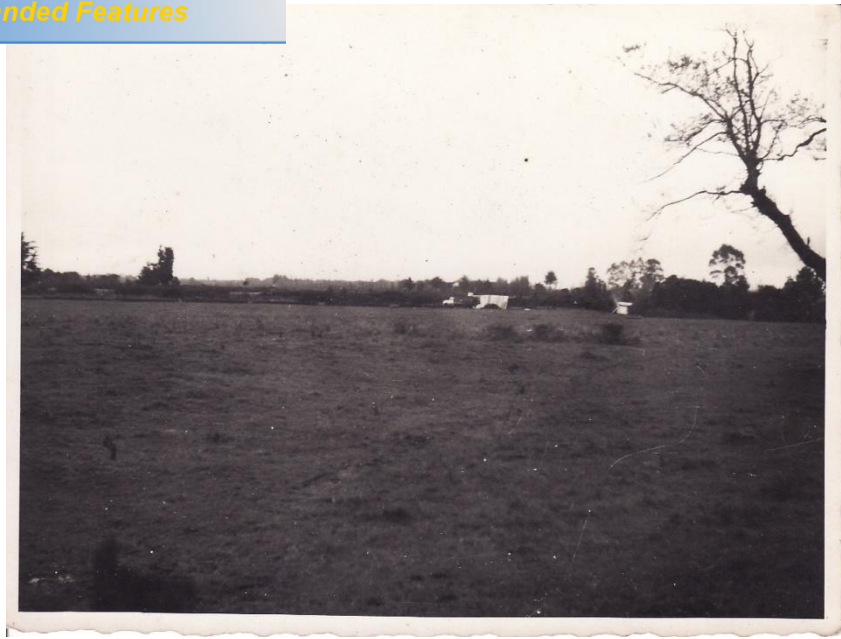
Fotografía 64. Comienzos de los Trabajos de los Pabellones de Emergencia