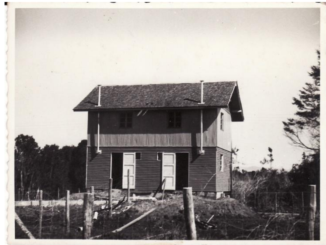
Fotografía 78. ò un tipo de las casa de población Holandaö