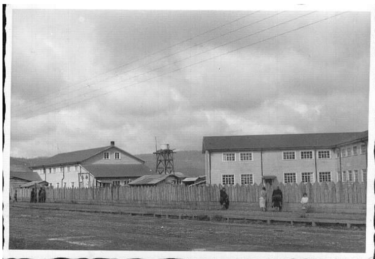
Fotografía 74. Escuela Misional 1962