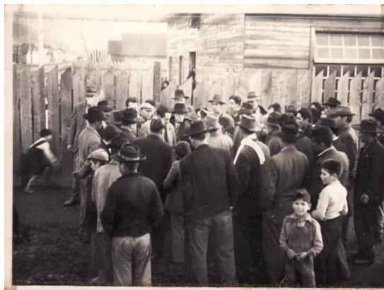
Fotografía 56.. Albergados recibiendo ayuda