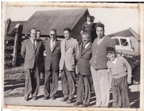
Fotografía 57. El alcalde (tercero de izquierda a derecha) y el regidor (último).

solidaridad nos deja este testimonio de la comuna