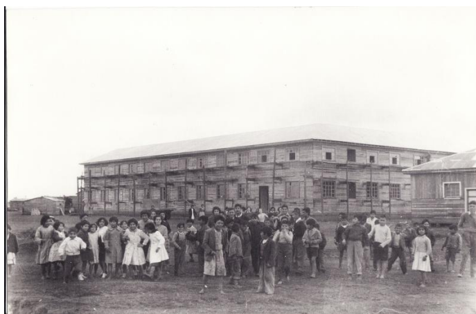
Fotografía 73. Escuela Misional 1961