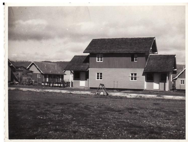
Figura 79. òUn tipo de las casa de población Holandaö