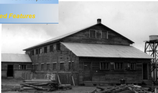
Fotografía 72. Escuela Misional 1961

Click Here to upgrade to Unlimited Pages and Expanded Features