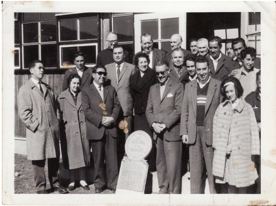
Fotografía 76. ð Delegación de Quinta Normal con algunas autoridades locales, ya en nueva Toltén

Un par de años mas tarde vuelve la delación de quinta Norma para dejar un bronce recordatorio