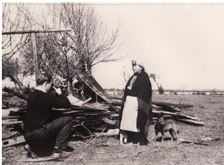
Fotografía 58. ¿Holandés realizando su filmaciones en septiembre de 1960¿material facilitado por Sra.Hilma Munro

A fines de septiembre regresó a Holanda la comisión encabezada por el pastor Van Nieuwenhuizen, luego de haber filmado algunos documentales sobre la gente y la región de Toltén. Merced a esa labor, el nombre del lejano pueblo chileno, habitado por humildes familias indígenas de campesinos y pescadores, pronto comenzó a ser conocido a través de los cines, diarios, revistas y pantallas de televisión en Holanda. Por los mismos órganos de publicidad quedó profusamente explicada su tremenda necesidad de auxilio material. Esta labor vemos reflejada en algunos texto (ver el texto completo en anexo 2) y en los siguientes imágenes. ¿Hay una atmósfera extraña en el pueblo. No queda nada, pero la gente acude a lo que fue su casa, aunque apenas reconozcan su tierra. Los niños están algo desorientados entre los restantes de su casa. Ya no hay escuela. ¿Pero, qué importa? Toltén ya no existe ... El suelo ha bajado de más de un metro y medio 3