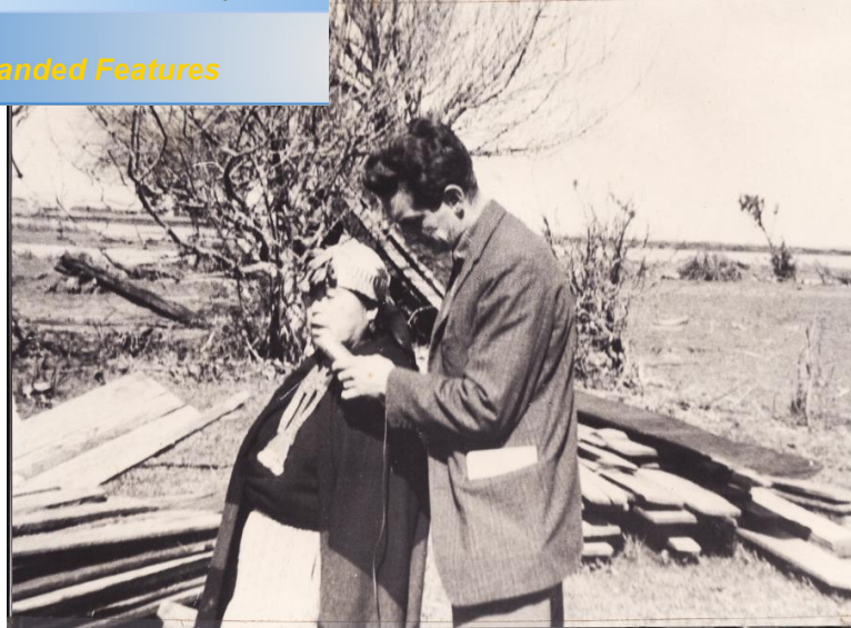
Fotografía 59. "Holandés realizando su labor en septiembre de 1960"

Click Here to upgrade to Unlimited Pages and Expanded Features