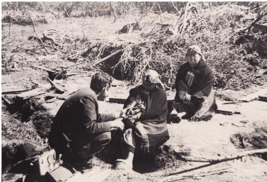
Fotografía 60. "Holandés realizando su filmaciones en septiembre de 1960"

"He perdido todo; mi casa, mi cama, mis animales. Nunca pedí ayuda y ahora tengo que vivir de limosnas. Mi suelo está enfermo, yo soy pobrísima, y nadie que me puede ayudar, porque todos son pobres." 4