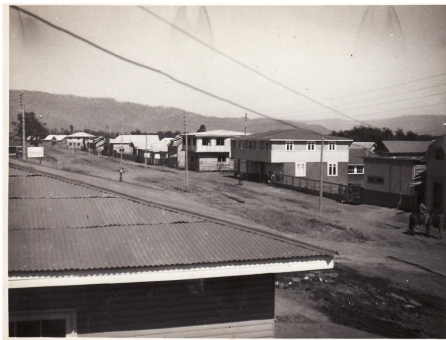
Fotografía 70. ò Viviendas de autoconstrucción en calle OøHigginsò