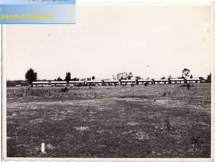
Fotografía 66. ò La finalización de los Trabajos ò material facilitado por Sra.Hilma Munro

Click Here to upgrade to Unlimited Pages and Expanded Features