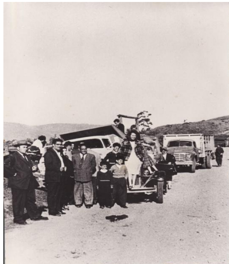
Fotografía 55. Camiones con ayuda.

Ya desde el 30 de mayo de 1960 la gran mayoría de la población se encuentra en Villa los Boldos, en conjunto con sus autoridades el alcalde recién electo el día 21 de mayo, don Enrique Nesbet, además de la municipalidad, el seguro social, correos y telégrafos y el registro civil . Llegan a este poblado 3 camiones provenientes con ayuda de los vecinos de Quinta Normal, como se ve en las siguientes fotos