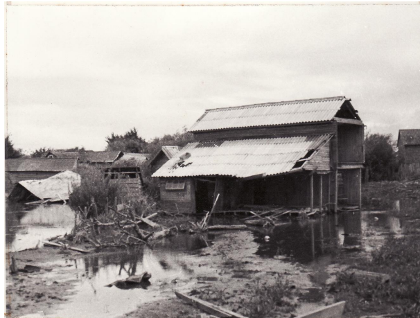
Fotografía 43. Casa devastada. . Material facilitado por Sra. Hilma Munro

Esta es una imagen aérea de Toltén el 25 de mayo de 1960, como vemos dentro de la imagen lo que brilla es el agua que aun esta en pueblo.