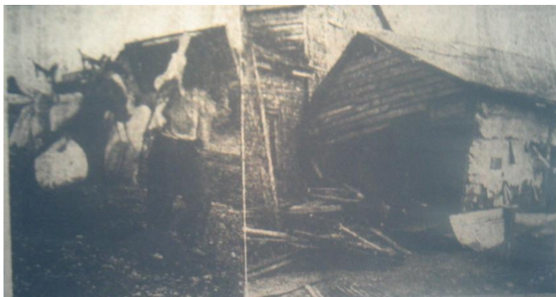
Fotografía 36. ÷Diario Austral 25 de mayo 1960ö. Material recopilado por Ximena Aceituno

En la fotografía 35: un aspecto de la calle principal de Toltén, tal como quedó después de maremoto. En la fotografía 36: en parte inferior izquierda, un sobreviviente aprovecha la marea baja para rescatar, a lomo de caballo, las escasas pertenencias de su hogar que pudo encontrar entre los escombros. Al lado derecho, una casa que la fuerza de la marejada arrancó e incrustó materialmente contra un edificio de la ciudad 12 .