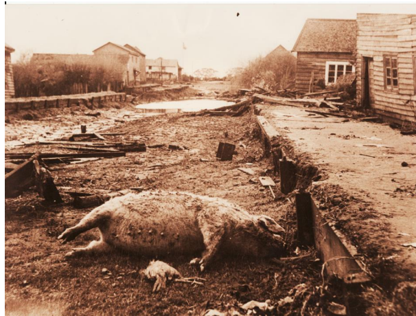
Fotografía 45. Devastación. .