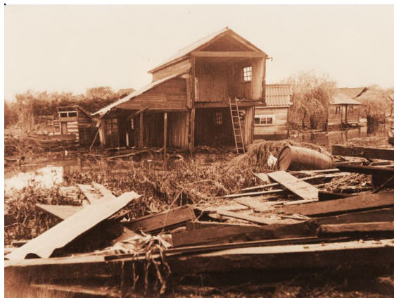
Fotografía 50 Viviendas devastadas. . Material facilitado por Sra. Hilma Munro