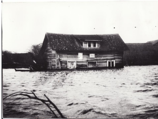
Fotografía 40. òel nivel de las aguas ö.