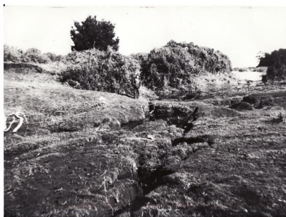
Fotografía 47. Grietas producidas por el terremoto. .