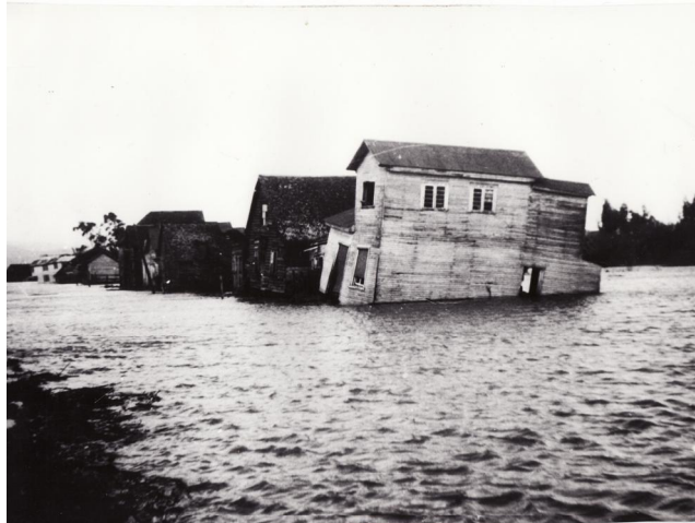
Fotografía 37. ¨Calle López 23 de mayo de 1960¨.

nos encontró acá, a la salida casi de pueblo así que nos tuvimos que devolver para atrás y en seguida nos subimos a reten de carabineros que había ahí con mi señora y mis tres hijos pero de ahí nosotros estuvimos como desde as 3 de la tarde hasta las 6 y tanto de la tarde y de ahí bajamos y volvimos a un local que tenía la cruz roja, como una sede que tenía la cruz roja como un hospital chico así y ahí pasamos la noche. 19