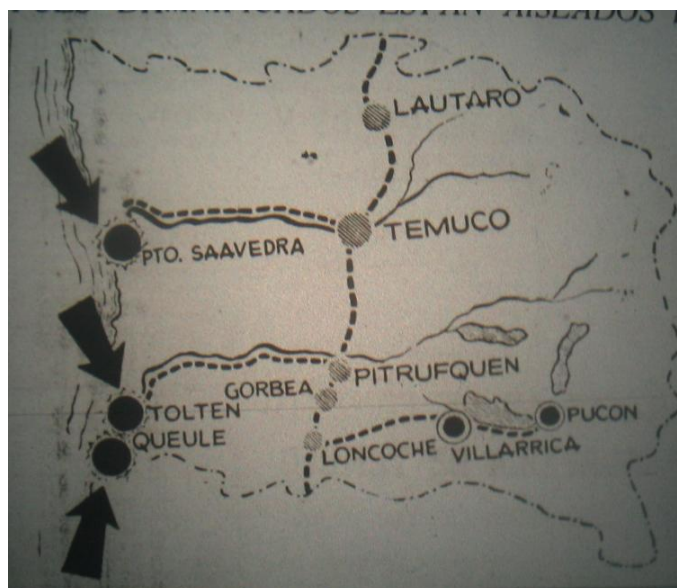
Mapa 2. «Diario Austral 24 de mayo 1960». Material recopilado por Ximena Aceituno

Después de realizar un vuelo por Cautín, el Diputado Fritz Hillmann y el Senador Julio Duran. Se entrevistaron con el ministro del Interior el Dr Sótero del Río quien dispuso la ayuda gubernamental necesaria con suma urgencia. El ministro dispuso que los gobernadores giraran los fondos con cargo al 2% constitucional; en materia de auxilio el inmediato envío de dos mil frazadas, tropas y alimento a los lugares destruidos y anegados en camiones militares por no disponer de helicópteros en buen estado. La solicitada evacuación de Puerto Saavedra, Toltén y Queule, se hará por carabineros espacialmente dotados. El salvataje de ganado mayor también lo hará carabineros. Se dispondrá la habitación y entrega de las casas para los evacuados de Toltén y Queule, que serán ubicados en la población de la Caja Carabineros de Pitrufquén y en la cárcel de dicha ciudad cuya obra gruesa aun no se encuentra terminada(í) Prácticamente desaparecieron Puerto Saavedra, Queule y Toltén. Tal es la más dolorosa impresión de los parlamentarios que hoy viajaron a cautín y pudieron sobrevolar para percatarse de los daños producidos por el maremoto. El mar barrió con las poblaciones enteras y la gente se encuentra refugiada en los cerros.