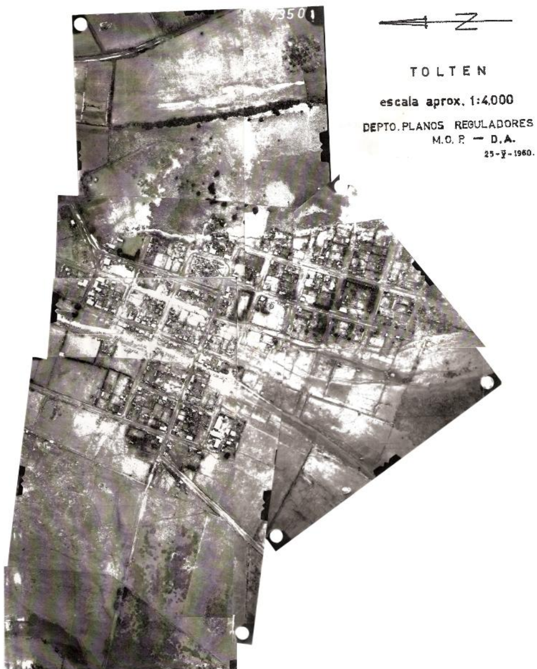
Fotografía 44. «Fotografía Área de Toltén el 25 de mayo 1960»

Las fotografías que siguen a continuación son cuando que comienza a decender el agua, lo que ocurre un par días después.