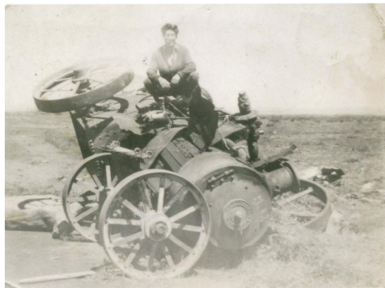
Fotografía 46. Locomovil destruido por el mar. . Material facilitado por Sra. Hilma Munro