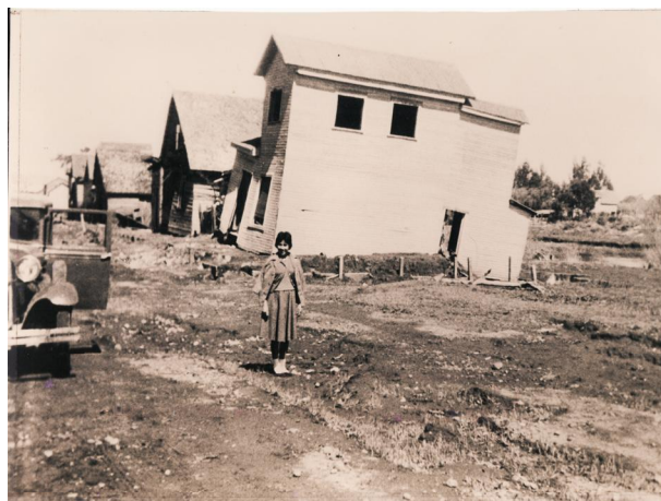
Fotografía 53. Calle principal (Olivares). . Material facilitado por Sra. Hilma Munro