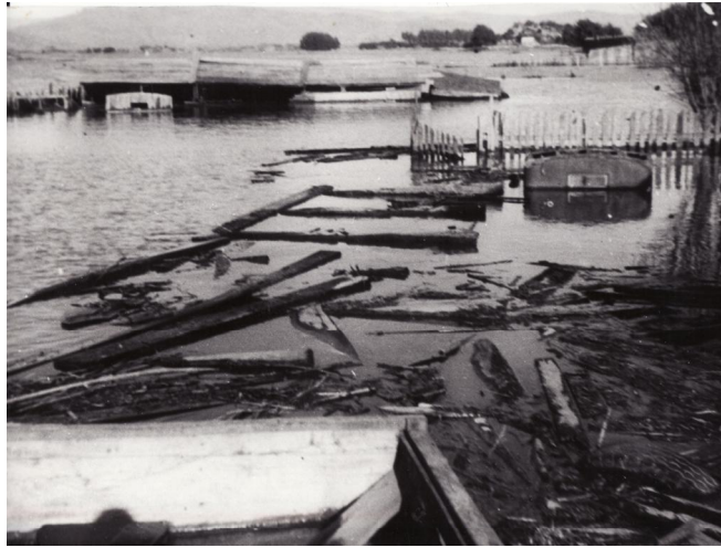
Fotografía 42. El mar aún no se retira. . Material facilitado por Sra. Hilma Munro