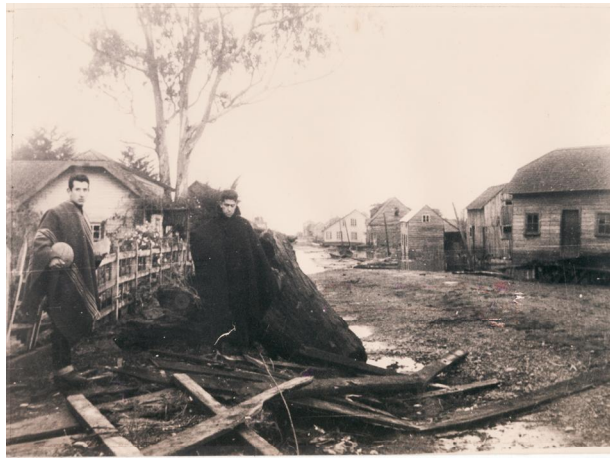
Fotografía 51. Vecinos contemplando el desastre. . Material facilitado por Sra. Hilma Munro