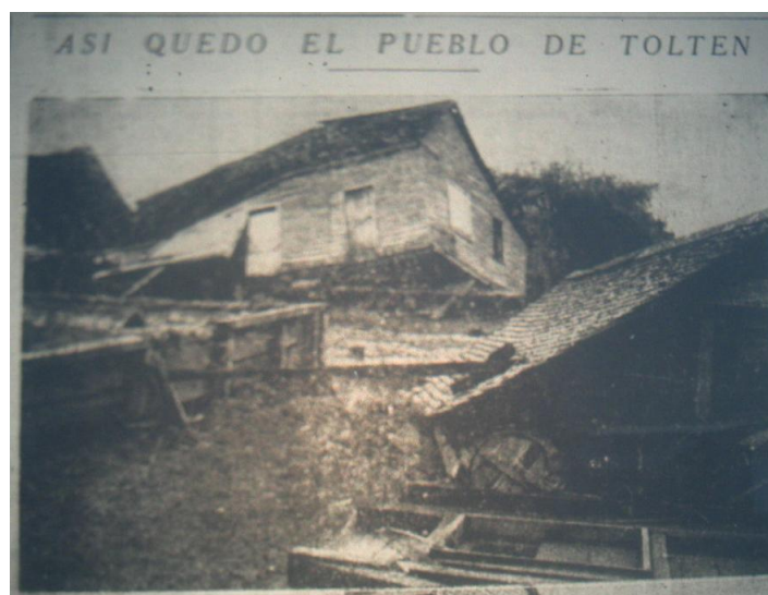
Fotografía 35. «Diario Austral 25 de mayo 1960». Material recopilado por Ximena Aceituno

El pueblo de Toltén ó Casi totalmente destruido, sin embargo hay un costado de la plaza con las viviendas casi intactas; las casas a orillas del río Toltén y el río Catrielf fueron destruidas o corridas por el impacto del agua; la municipalidad está semi-destruida, al igual que la mayoría del comercio. La parte vecina al colegio de las monjitas está bien; se estima que sólo el 10% de las casas esta en pie, aunque con varios daños. Durante el día hubo saqueos y se temía que siguieran en la noche del 23 y 24. 11 Sobre la situación de los pobladores menciona que no hay noticias exactas ya que hay personas que se resisten a abonar sus predios, la mayoría de evacuados están en Villa los Boldos, unas 250 personas y unas 80 personas evacuadas en Pitrufrquén.