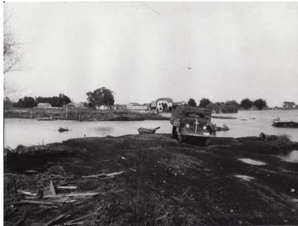
Fotografía 52. Entrada al pueblo. .