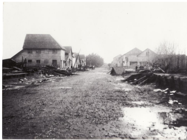
Fotografía 49. Una vez descendida el agua. . Material facilitado por Sra. Hilma Munro