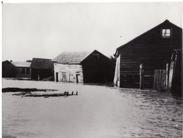
Fotografía 41. ò la calle inundada por el marö.