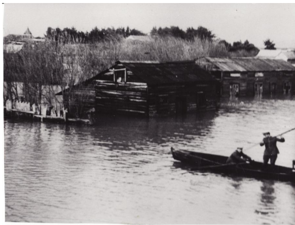
Fotografía 39. òCarabineros en busca de cuerposö. Material facilitado por Sra. Hilma Munro

A continuación algunas fotografías de la tragedia, primeramente cuando estaba aun el agua en pueblo.