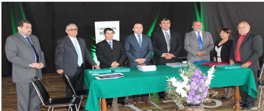
Concejo Municipal de la comuna de Toltén periodo 2016-2020.