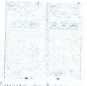
Tarjeta de Asistencia