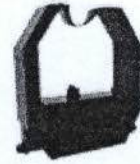
Cinta Marcación Bicolor