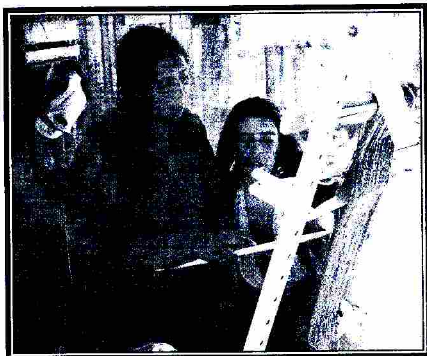
*Capacitaciones con Agricultoras

En adelante curriculum vitae de la profesional y certificados de experiencia.