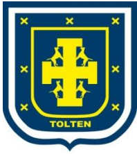
TABLA REUNION ORDINARIA N° 114/2020