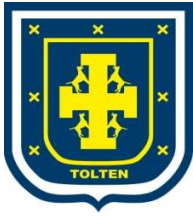
TABLA REUNION ORDINARIA N° 040/2018